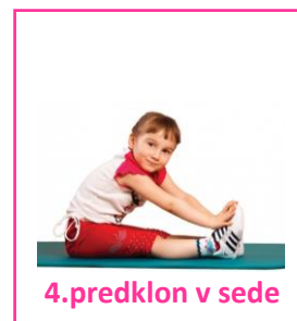
4.predklon v sede