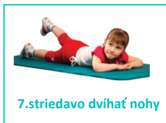
7.striedavo dvíhať nohy