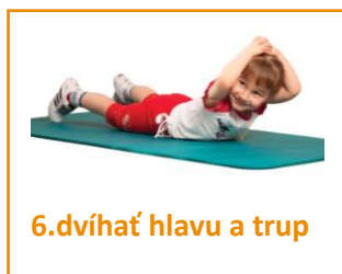
6.dvíhať hlavu a trup