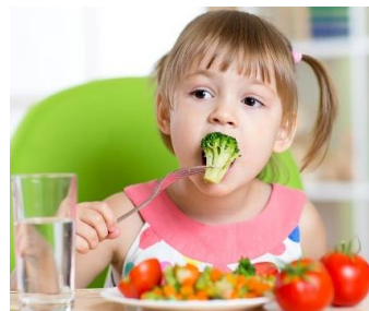
To je dobrá zeleninka