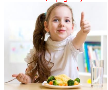
pre Zuzku sú dobrotky