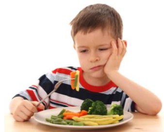
Bruško kričí- ja chcem jesť!