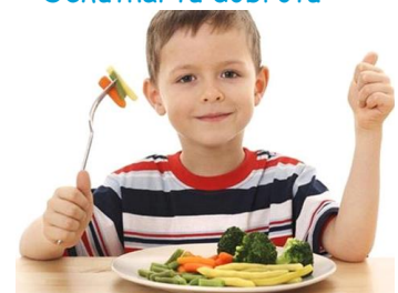
a bruško má robotu